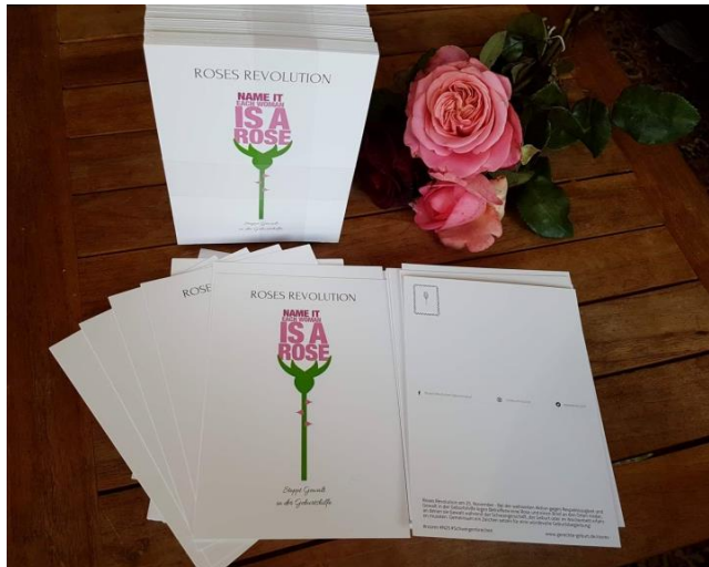
Roses Revolution 2018: Neben Rosen & Briefen werden auch Postkarten abgelegt

Die Berichte, die Eltern und zum Teil auch Klinikpersonal im Zuge der Roses Revolution 2017 veröffentlicht haben, beschreiben körperliche, mentale und strukturell bedingte Gewaltanwendungen. Zudem legten sie